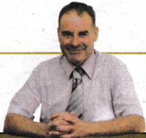
ENTREVISTA AMB L'ALCALDE DE BLANCAFORT