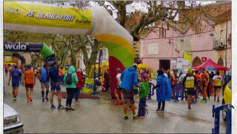
Novament, l'organització va estar a un gran nivell i tot va sortir sobre el previst.