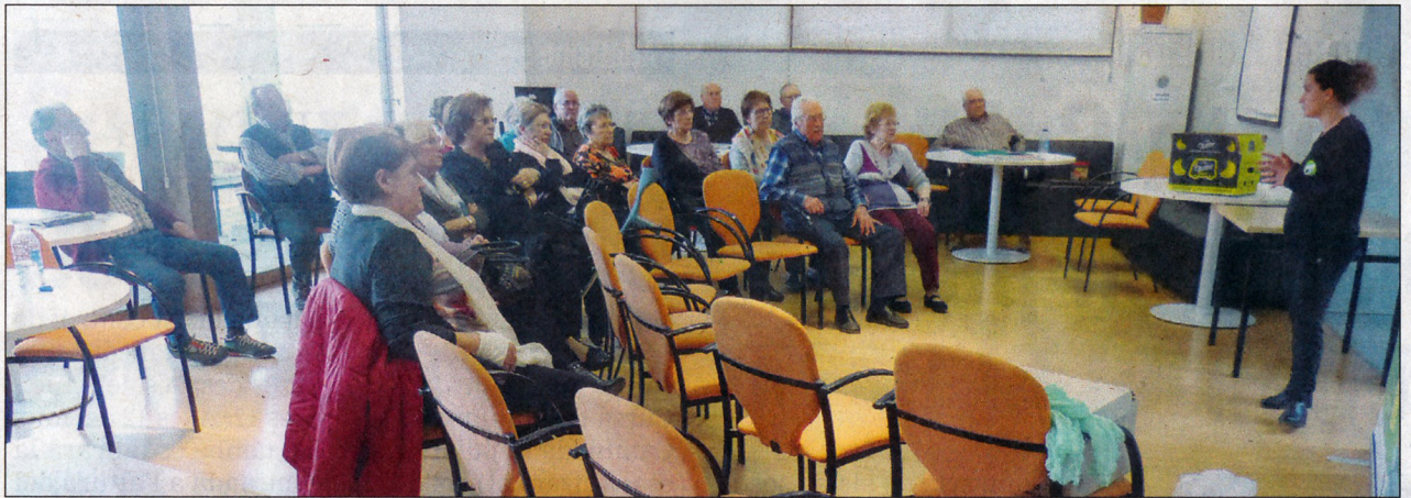
Bona assistència a aquesta interessant xerrada.

CONFERÈNCIA. Al nostre país, cada any es llencen 262.471 tones de menjar