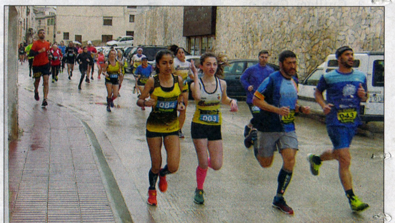
Els quasi dos centenars d'atletes van omplir d'activitat la matinal atlètica de Blancafort.

(00:22:58); 4a Marta Conesa Samaniego (00:23:51); 5a Sara Martínez Torres (00:24:02).