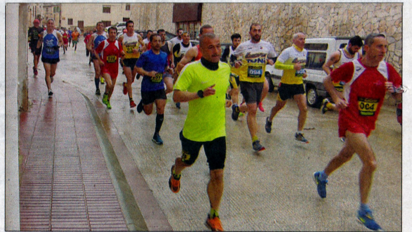
Atletes de totes les edats van prendre part en aquesta nova cita atlètica a Blancafort.