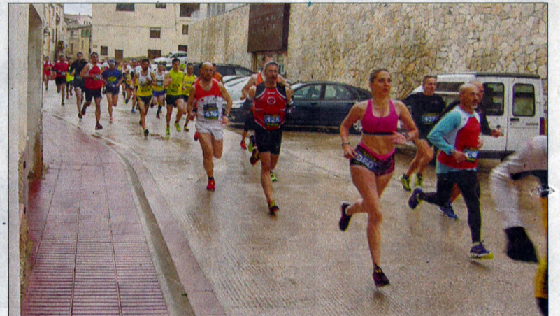
El temps no va ser impediment per viure una gran jornada atlètica a Blancafort.