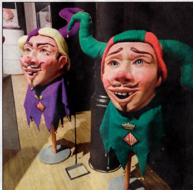
Imatge dels nans blancafortins.

L'exposició es troba situada a la sala d'exposicions del Centre d'Artesania de Catalunya, al carrer Banys Nous, 11. Romandrà oberta fins al diumenge 20 de gener.