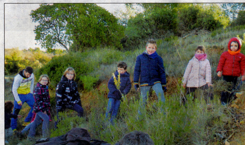
El local social de la localitat va acollir bona part dels actes viscuts, i també el bosc en va ser escenari.