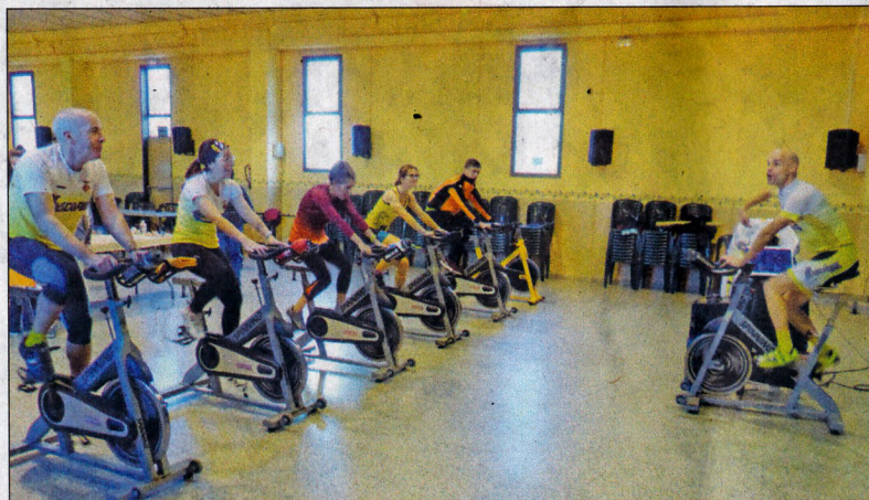
Gran implicació de la societat blancafortina en els actes de La Marató d'enguany.

Ja a les 11, de tornada al local social i per recu-