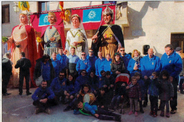
Blancafort va estar molt ben representada en aquesta cita de Figuerola del Camp.

A partir de les 11, va tenir lloc la plantada dels elements participants a la plaça Sant Jaume i l'esmorzar per a les colles a la cooperativa del municipi. Al punt de les 12 del migdia començà la cercavila, que va transcórrer pels principals carrers de la població, els quals estaven decorats per a