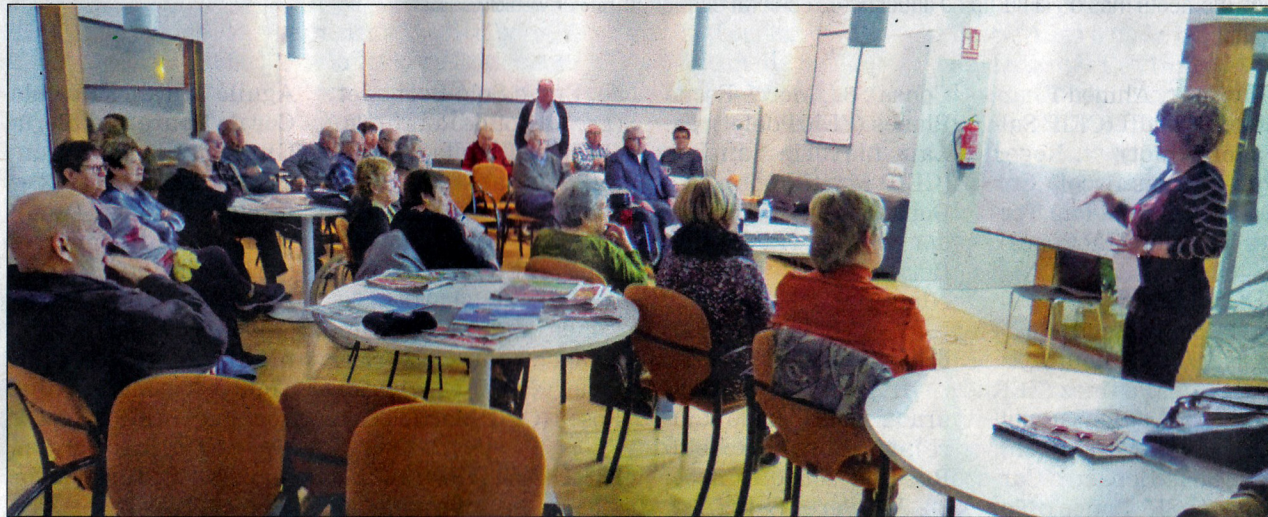
Molt bona assistència, la que va registrar la xerrada.

El fet que la ponent ja sigui coneguda del Casal, i de la mà de la seva simpatia i la forma de dirigir el