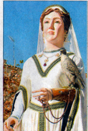
La geganta de Blancafort.

L'Associació Cultural Gegants de Blancafort engresca tothom a assistir-hi. Sobretot, un dels objectius principals de l'esdeveniment és poder reunir una àmplia majoria dels gegants existents a la Conca de Barberà.