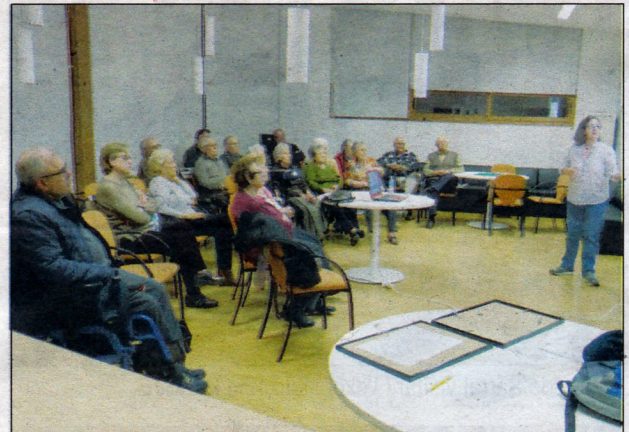
Vista de quan es feia la interessant xerrada.

1) Hi ha danys a determinats nervis o teixits per factors externs: cremades, intervencions quirúrgiques, accidents o malalties