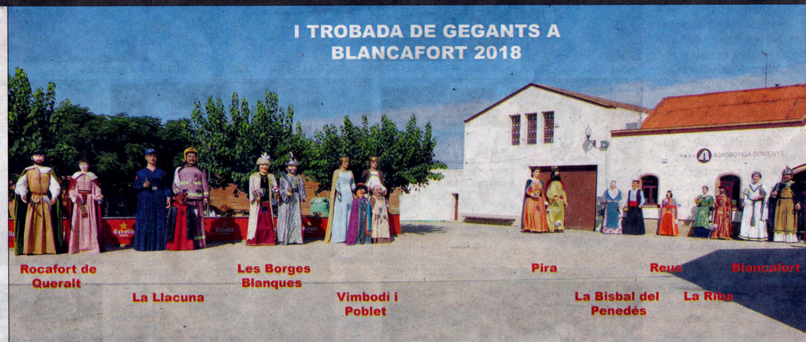
I TROBADA DE GEGANTS A BLANCAFORT 2018

Passada la mitjanit, va arrencar la nit de marxa amb el grup de vers-