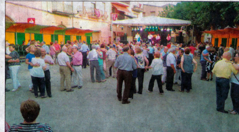
Un moment del ball i un dels espectacles que es va poder gaudir durant la Festa Major.