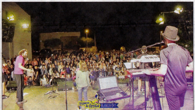
Grup de versions Karaokes Band 2.

Dilluns va destacar el recurrent concurs de tir a la diana amb carrabina d'aire comprimit. Cal destacar que en tot moment els concursants estan sota la guia i vigilància