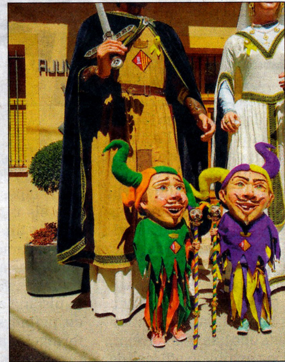
La gent va saber respondre a l'atractiu d'aquesta primera trobada de gegants que es va viure a Blancafort.

FOLKLORE. La cita amb la primera trobada, que va ser tot un èxit, va arribar diumenge, dia 26 d'agost