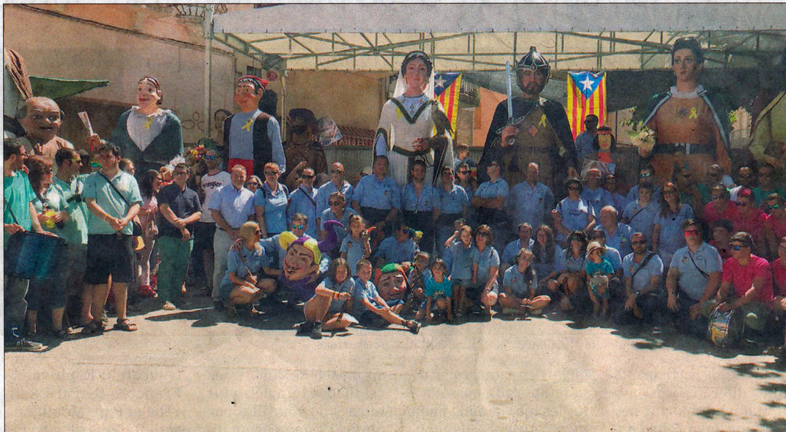
Gran satisfacció per l'èxit assolit en aquesta primera trobada.

La plantada es va realitzar a la plaça del Sindicat, amb l'esmorzar per a les colles, que tingué lloc al Local Social. Cap a quarts de dotze començà la cercavila, que va transcórrer per diversos