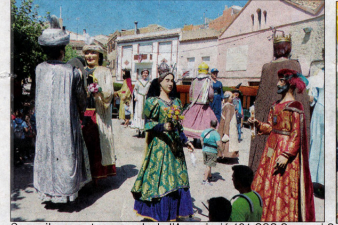
Cercavila geganter, parada de l'Associació 101 SOS Gossos i Sopar del Gos.