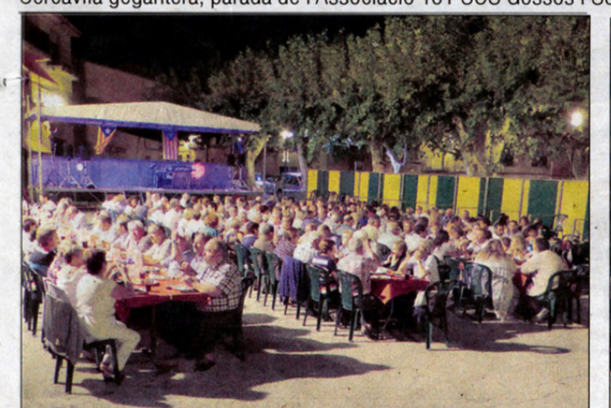
Més moments del Sopar del Gos i, també, el taller de manualitats viscut.