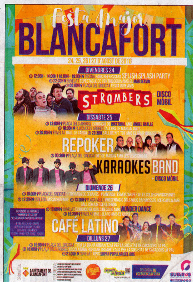
Cartell de la Festa Major d'enguany.

Ja dilluns hi haurà l'ocasió de participar en el tir a la diana, i posteriorment assistir a una xocolatada popular, ambdues activitats organitzades per la Societat de Caçadors la Pau. Com a tancament de la festa, dilluns a la nit, un any més, es podrà assistir al veterà i típic