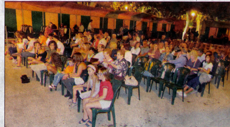
Assistents a un dels espectacles, i un moment de la demostració de bicitrial; a sota, festa jove amb Strombers.