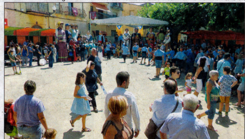
Més moments de la I Trobada de Gegants viscuda amb motiu de la Festa Major 2018.