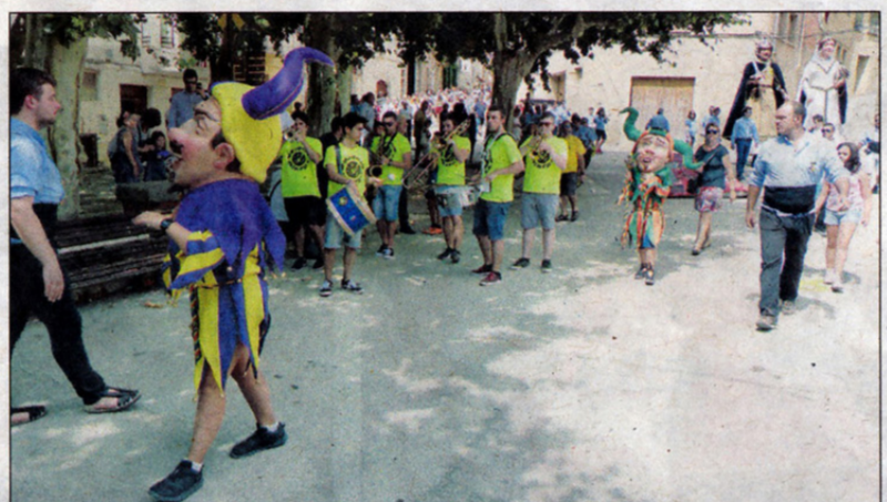
La I Trobada de Gegants viscuda a Blancafort va ser realment un èxit en tots els sentits.