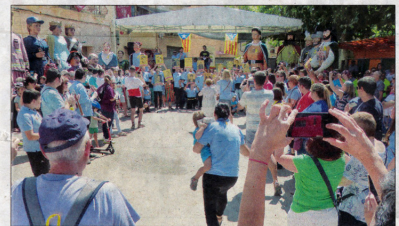
No hi van faltar els moments reivindicatius, en aquesta I Trobada de Gegants.

FESTA MAJOR BLANCAFORT DEL 24 AL 27 D'AGOST