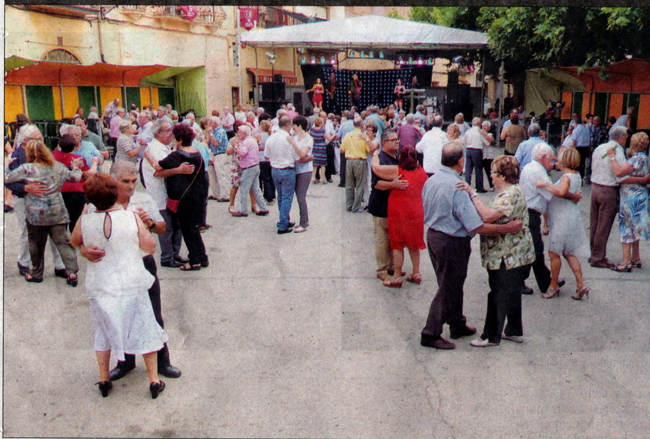
Blancafert espera viure uns dies de diversió i germanor al voltant de la festa.