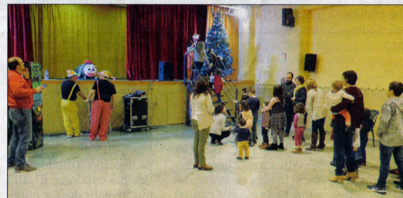
El cagatió és sempre un dels moments més esperats per tots els nens i nenes de Blancafort.