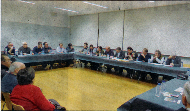
El Consell d'Alcaldes es va reunir a les magnífiques instal·lacions de Blancafort.

Així, a les set de la tarda, com estava pro-