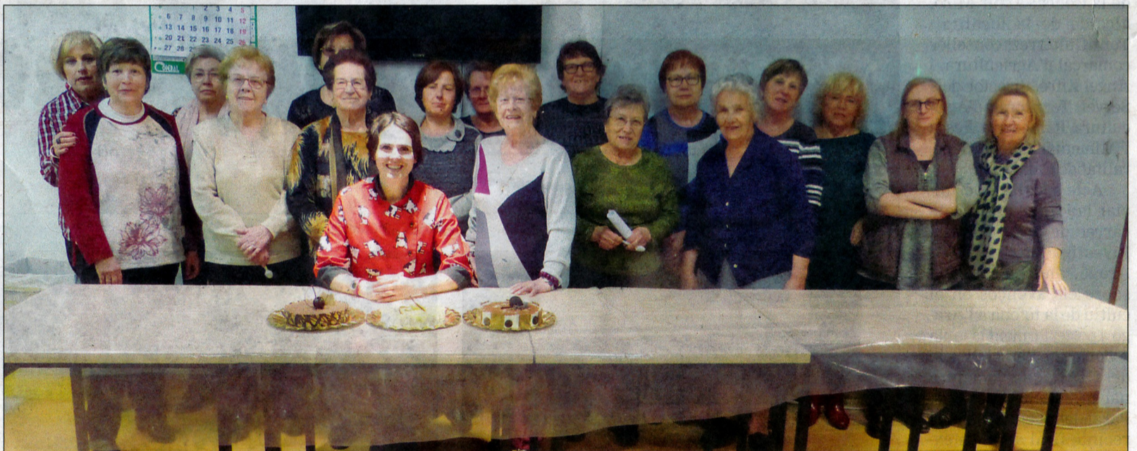
Dones participants en un taller de pastisseria, entre les moltes activitats dutes a terme.