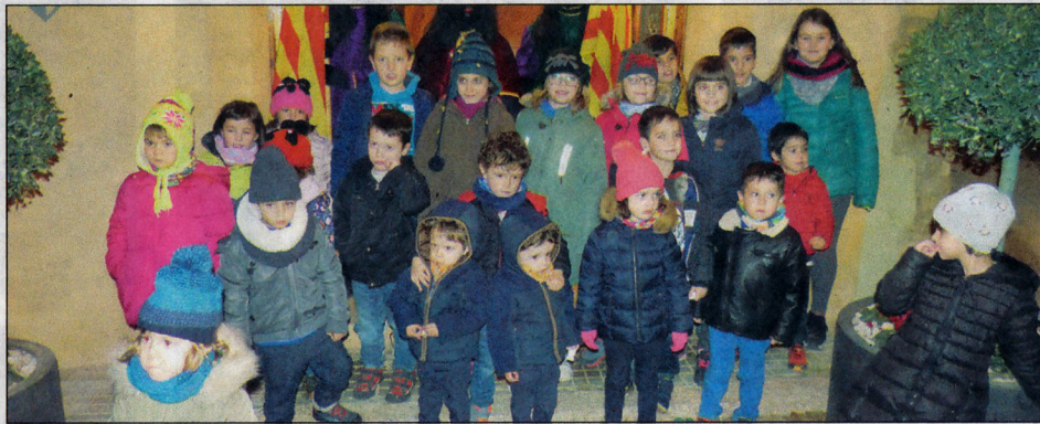
Nens i nenes amb cares il·lusionades esperant l'arribada de Ses Majestats.

Des d'aquí es vol felicitar els Joves de Blancafort per la seva tasca en la conducció del protocol, coordinació i suport aportats a tan il·lustres dignataris.