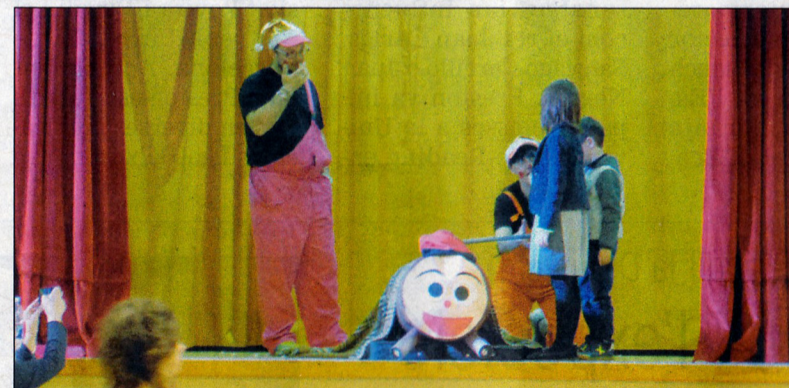
Uns petits fan cagar el tió, i a la dreta, moment del concert de Nadal.