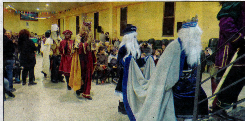
Multitudinària recepció, la que van tenir els Reis Mags d'Orient per part de la gent de Blancafort.