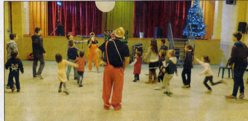
Més moments del cagatió viscut a la localitat de Blancafort.