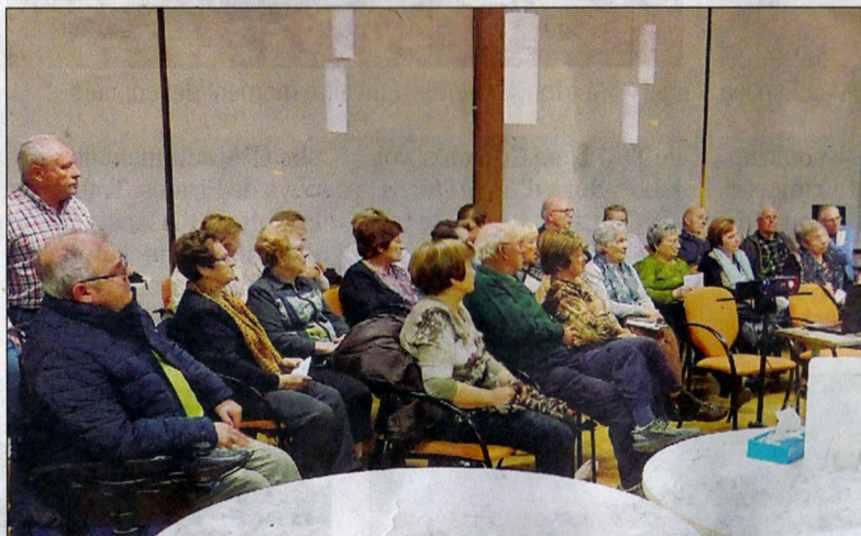
Assistents a una de les conferències dutes a terme, i a la dreta, bon berenar celebrat.