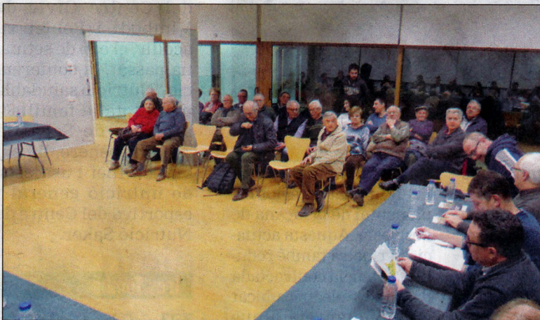
El plenari va ser obert al públic i no va faltar un bon tast de productes locals.