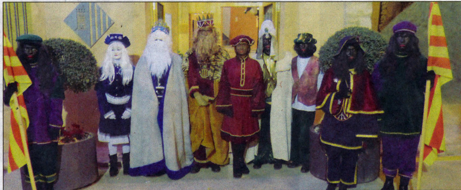
No hi va faltar la recepció oficial de Ses Majestats per part de les autoritats de Blancafort.