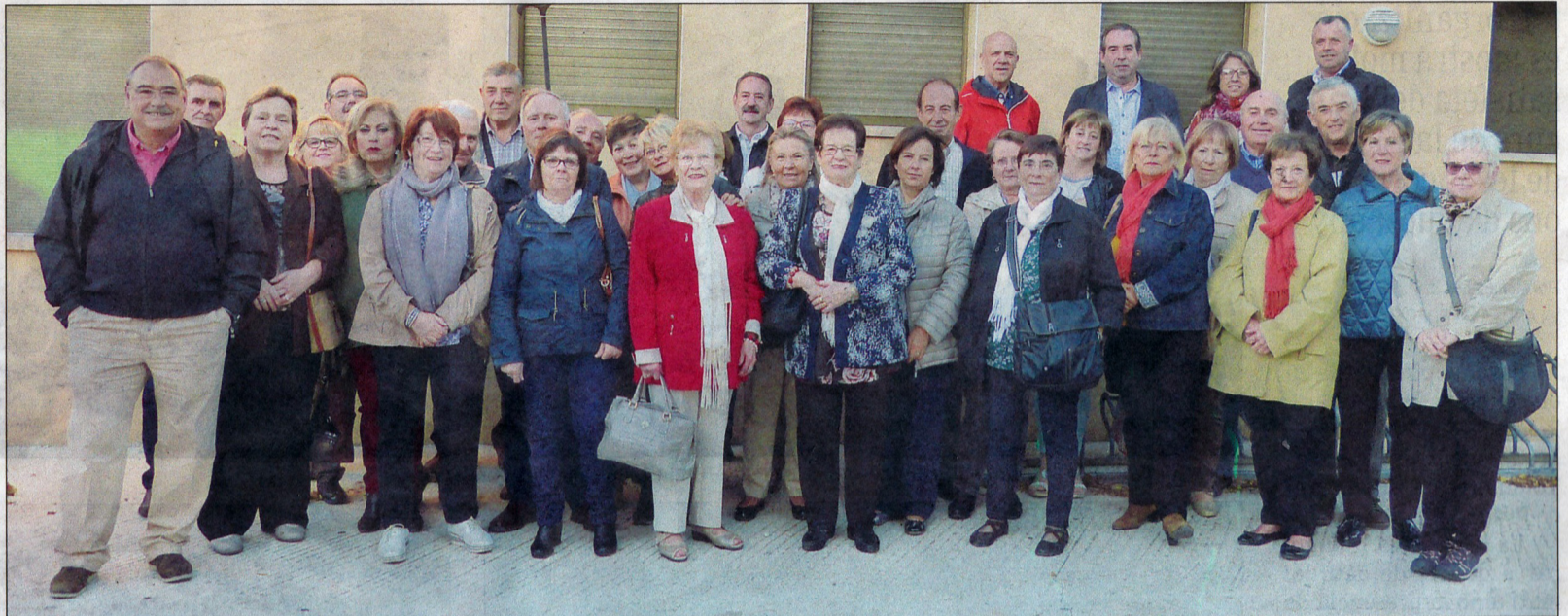
Participants en la sortida cultural que es va celebrar.

Pel que fa al registre de socis, i tenint en compte els moviments d'altres i baixes, a 31 de desembre del 2017 queden fixats en 105 membres, amb què es mostra una tendència a la baixa en relació amb els existents a finals de l'any 2016. Es va informar de les noves altes produïdes al llarg de l'any, amb un total de quatre persones, a les quals es dona la benévola.