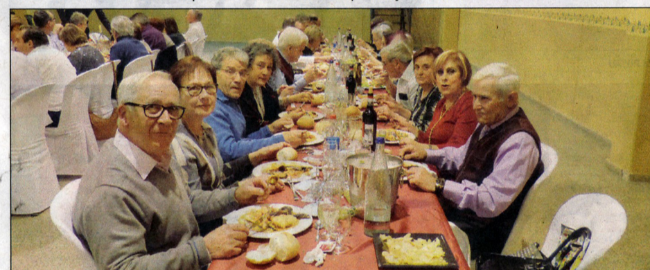
Tothom va gaudir del sopar que es va oferir en el marc de la revetlla de Cap d'Any a Blancafort.