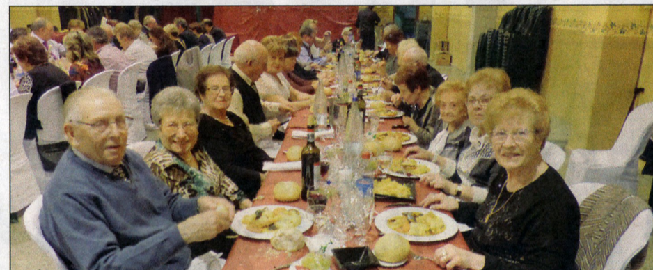
Molt bon ambient en el sopar de la revetlla de Cap d'Any celebrat.