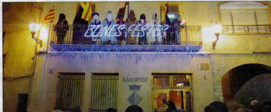
Els Reis Mags d'Orient, al balcó del consistori, i a la dreta, una altra imatge de la cavalcada.