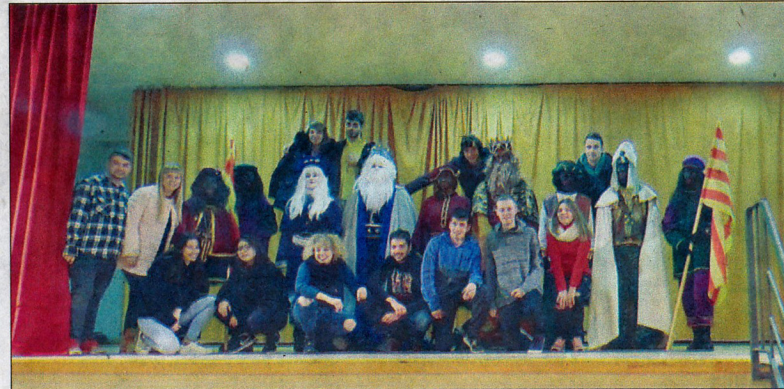
Els joves de Blancafort van fer una gran feina perquè l'arribada dels Reis i la seva estada a la població fos tot un èxit.