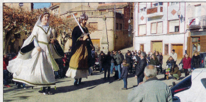
Una imatge de la ballada de gegants, i a la dreta, divertit cagatió.