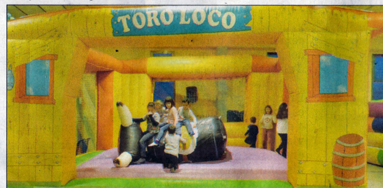
Parc de Nadal ple d'atractives propostes per a tots els joves de la localitat.