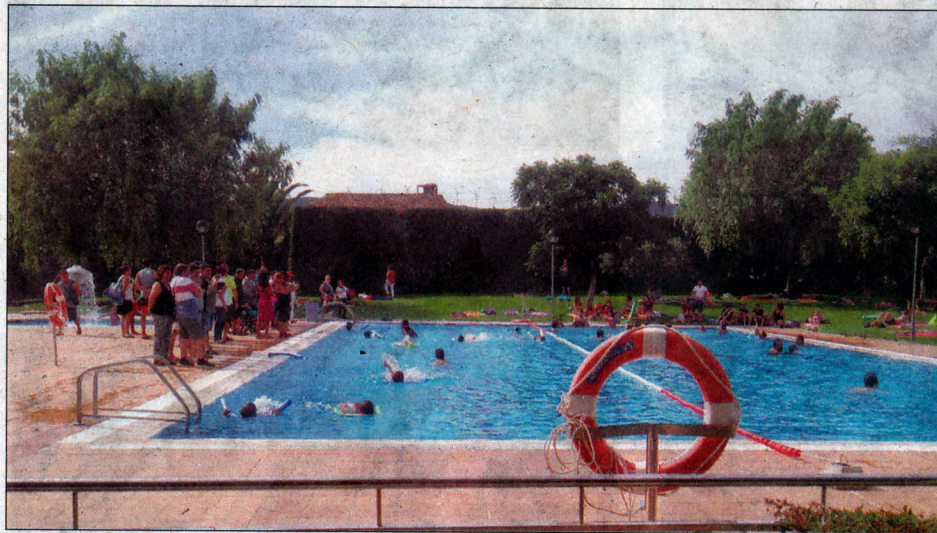
Molta acceptació del curs organitzat a Blancafort.

El dissabte dia 21 a la tarda es va celebrar la festa final del curs de natació d'enguany, amb l'entrega de medalles commemoratives a tots els participants. A l'acte hi van assistir el primer