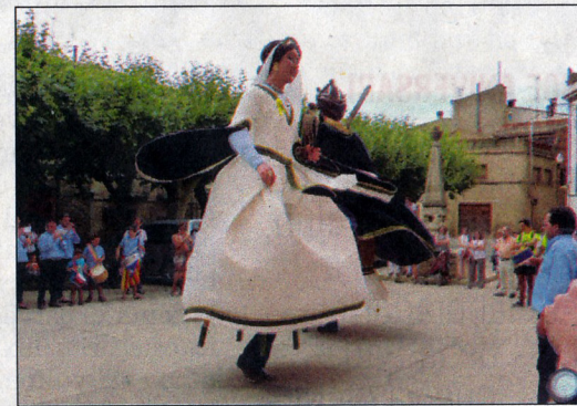
Elaboració de la fideuà del sopar; venda de samarretes festives i més actes dels gegants locals.