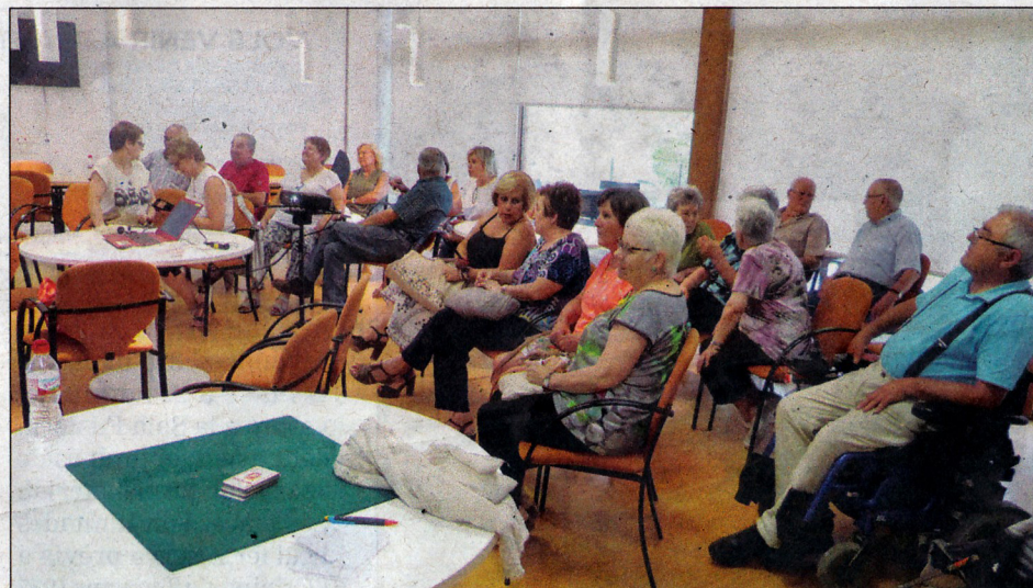
Diferents moments i molta participació en aquesta xerrada viscuda divendres.

Volen destacar que, si bé aquests projectes són dissenyats des de i per a aquest col·lectiu, els fan