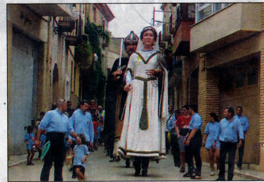
Animat ball el que es va celebrar després del sopar de germanor i presència, diumenge, dels gegants de la localitat.