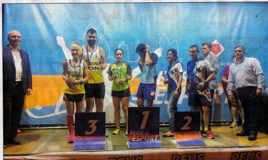
Molt bones actuacions dels atletes de l'AE Blancafert.

Des de l'entitat volen donar-los l'enhorabona a tots.