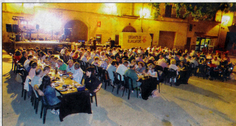
Multitudinària presència al sopar popular i de germanor de Santa Magdalena.