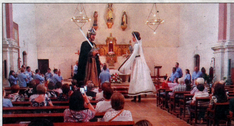
Els gegants Blanca i Fort van tenir un gran protagonisme durant la jornada de diumenge.