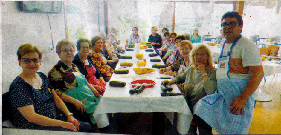
Dues imatges d'aquest profitós taller.

El divendres 8 de juny va tenir lloc la primera sessió dels tallers monogràfics dedicats a la cuina. Aquest taller, organitzat pel Casal de la Gent Gran amb la col·laboració i suport de l'Ajuntament de Blancafort i Consell Comarcal de la Conca de Barberà, forma part del cicle d'activitats programades per a l'any 2018 projectades i