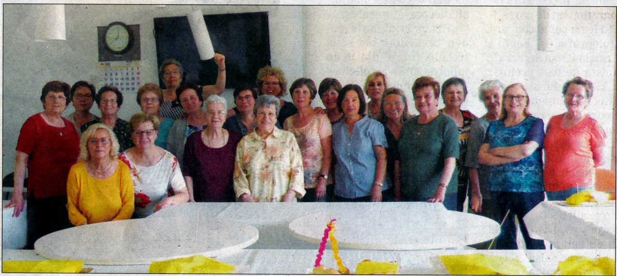
Participants en aquesta segona sessió del taller de cuina.

TALLER. Es va celebrar organitzat pel Casal de la Gent Gran