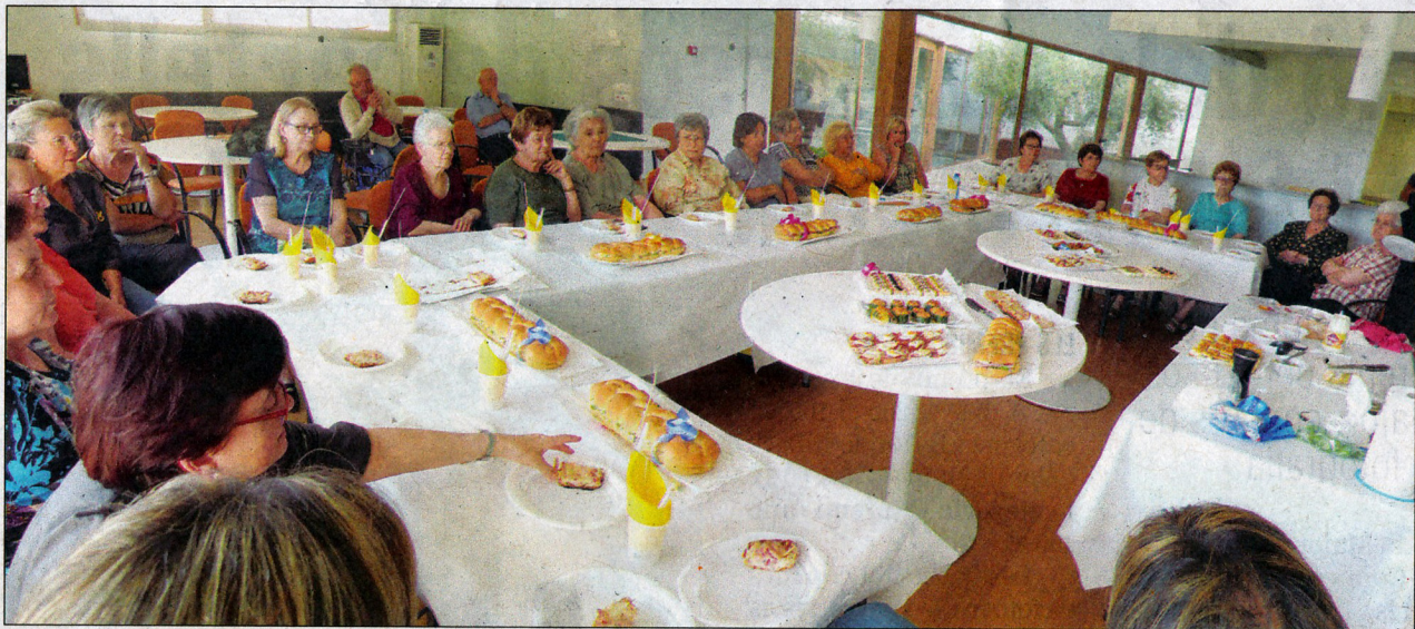
No hi va faltar un bon tast de tot el que havien après a elaborar.