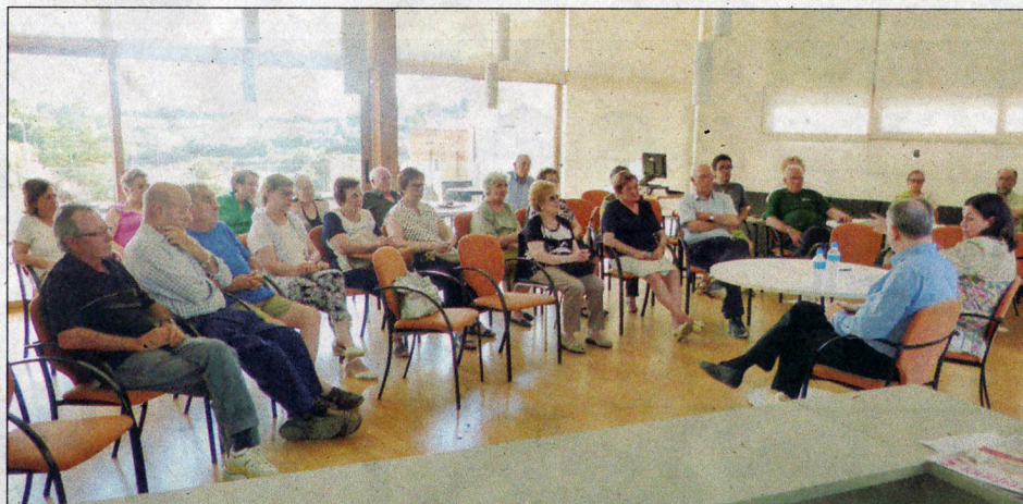
Bona assistència a la conferència, que va comptar amb dos conferenciantes.

Organitzada pel Casal de la Gent Gran amb