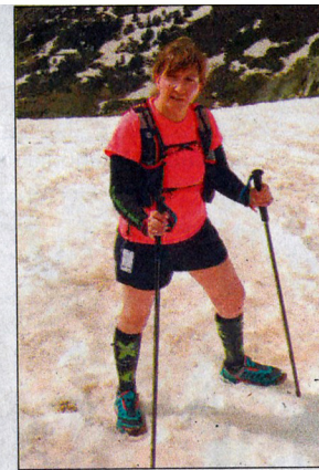
Satisfacció per la feina ben feta a les diferents proves atlètiques.