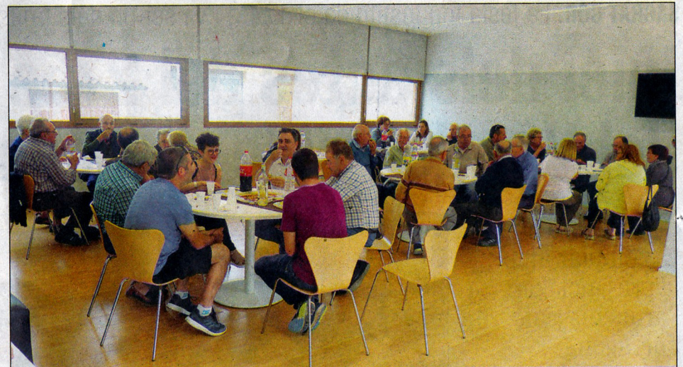
Tothom va seguir amb molt interès les explicacions sobre el funcionament i serveis del centre.

CENTRE DE DIA. L'obertura d'aquest Centre de Dia de Blancafort està prevista per al proper dia 25 de juny