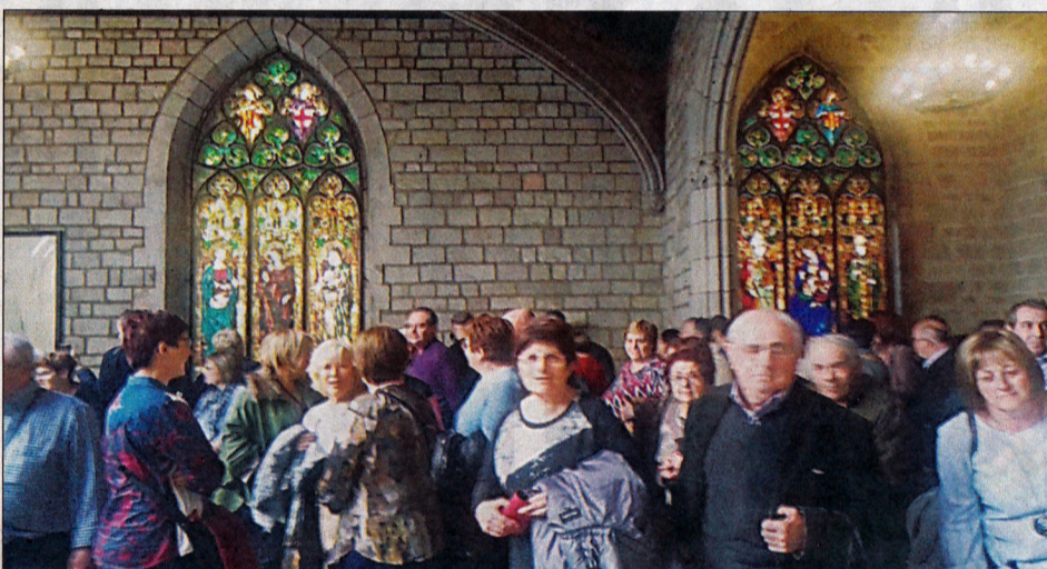
Un moment de la visita a l'ajuntament de Barcelona.