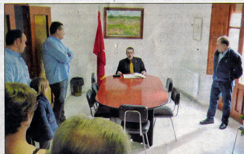
Més moments de l'acte a l'ajuntament, i a sota, actuació dels elements populars locals.