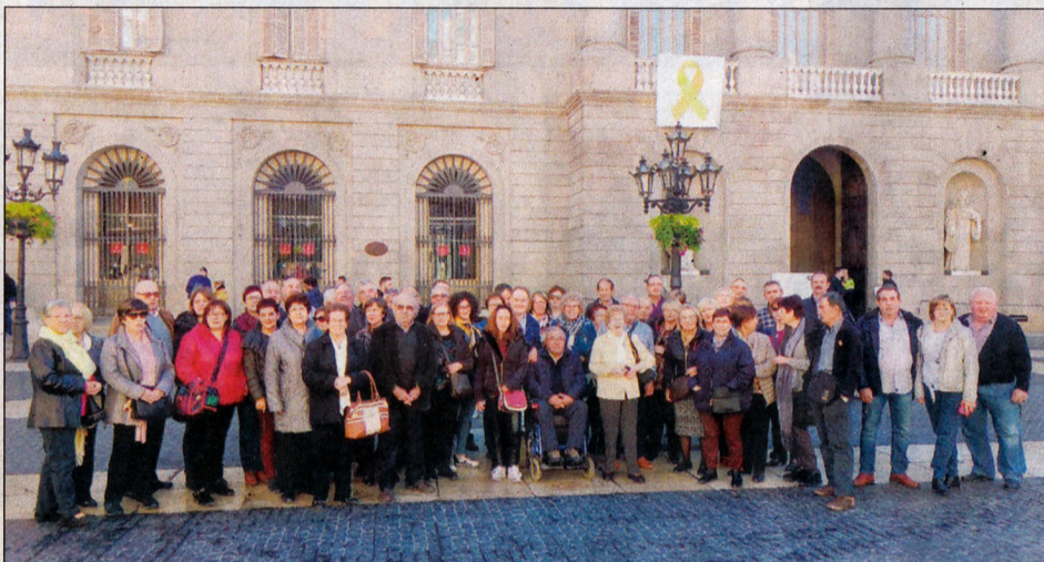
Els participants en la sortida, a la plaça de Sant Jaume.