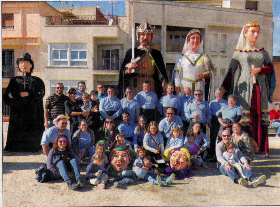
Imatge de la comitiva blancafortina i dos moments de la Trobada.

La festa va començar amb la plantada que va tenir lloc a la rambla Pau Casals, on també tingué lloc l'esmorzar per a les