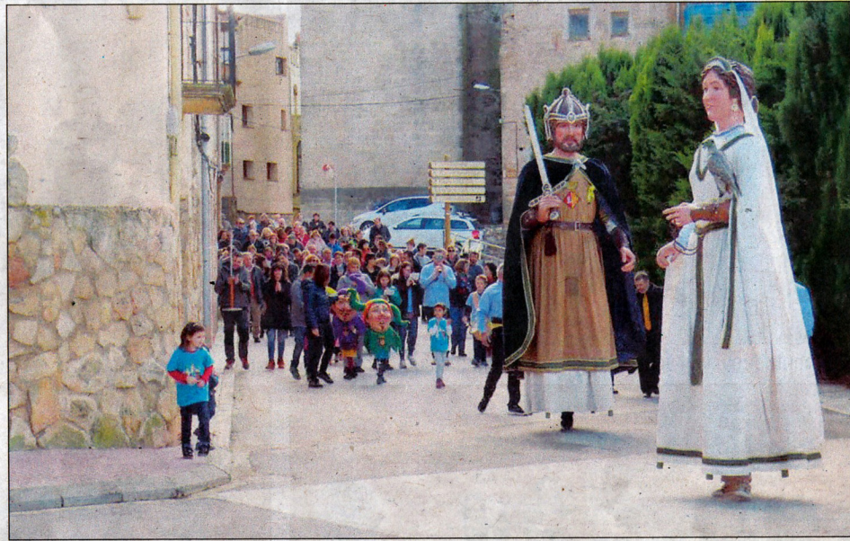
Dos moments dels compromisos viscuts pels gegants blancafortins aquest cap de setmana passat.