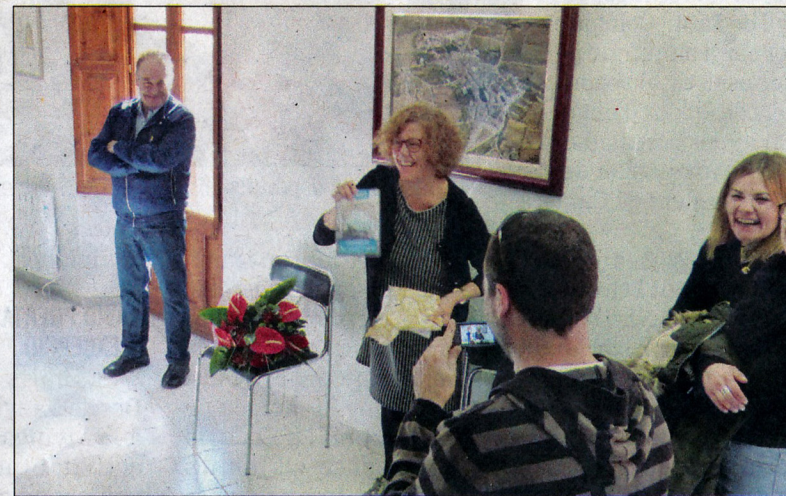
Acte ben emotiu, el que es va viure a les dependències del consistori.