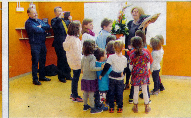
Emotius moments d'alumnes, pares i mares, que van reconèixer la seva directora, que es jubila.