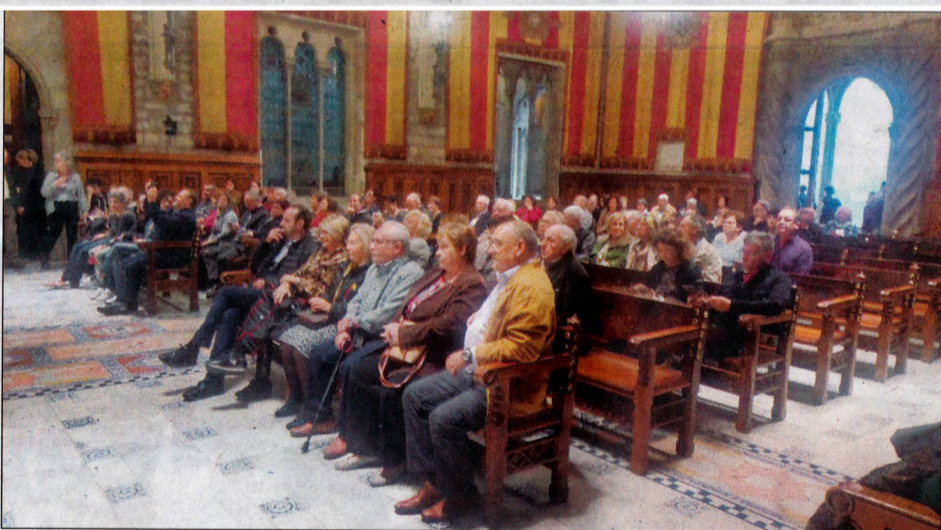
Més imatges de la visita a l'ajuntament de la capital.

Aquesta sortida és una de les diverses activitats culturals que el nostre ajuntament ofereix i realitza al llarg de l'any, oferint un petit ventall per conèixer altres indrets i fer un tastet de les novetats actuals.