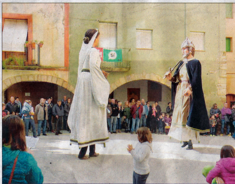
Blancafort i Vilaverd, les cites del cap de setmana.

A l'ajuntament hi va tenir lloc l'acte institucional, en què se li va fer un reconeixement per la