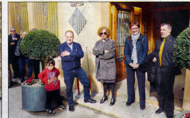
Moments previs a l'acte de reconeixement a l'ajuntament.