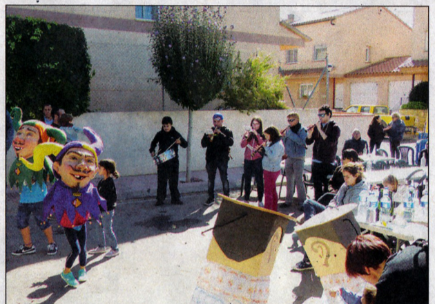
Diferents moments viscuts aquest diumenge, dia 7.

1-0. En commemoració dels episodis que van tenir lloc i que vam viure l'1 d'octubre del 2017