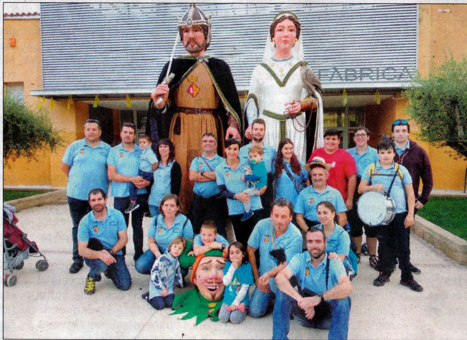
Destacada presència dels gegants de Blancafort a l'Alt Camp.

fins al recinte firal, on tingué lloc el repartiment de records i la ballada final conjunta de tots els gegants participants. La festa va finalitzar amb un berenar