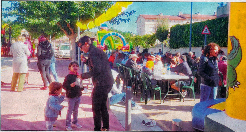
Des de primera hora del matí, els geganters ja preparaven un bon esmorzar popular.