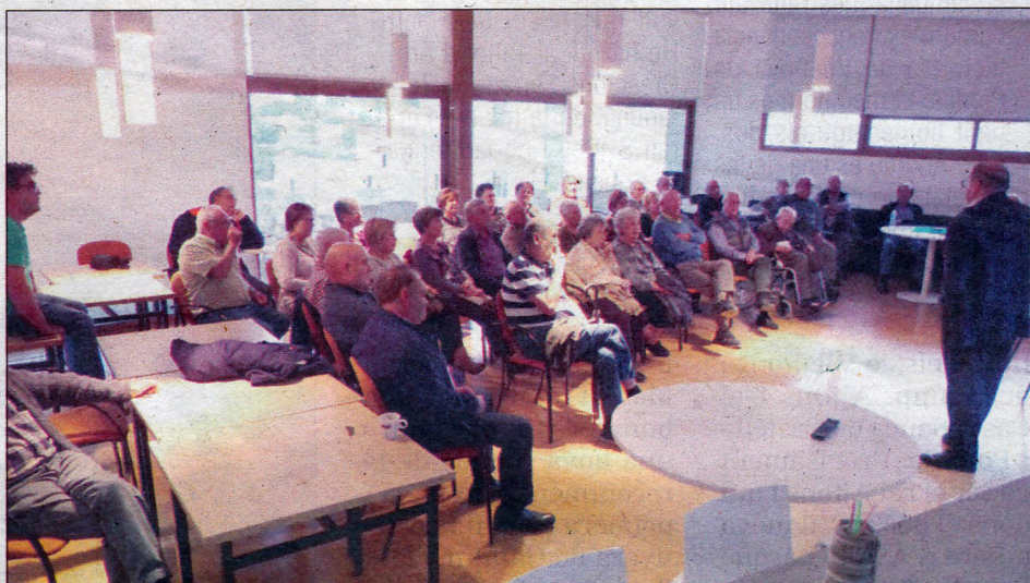
Dos moments de la interessant xerrada de divendres, dia 19.

Va parlar de l'ocupació musulmana del territori i va explicar com es