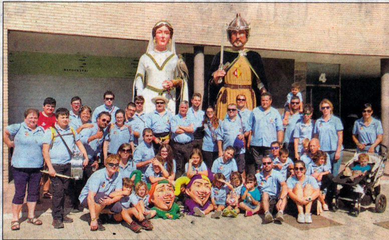
Lluïda presència blancafortina en aquesta població del Baix Llobregat.

Enguany, la trobada comptava amb un triple aniversari. Per una banda, se celebrava el 30è aniversari dels Gegants Nous, Bernat i Candeleira, i també es commemoraven els 30 anys de la proclamació de "Molins de Rei, Ciutat Geganter de Catalunya 1988". Tam-