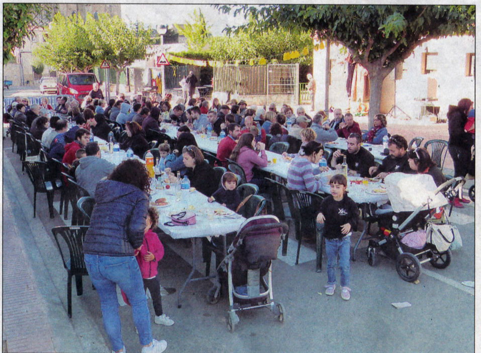
Bon i participatiu esmorzar, el que es va oferir.

Aquest aniversari va ser organitzat per l'Ajuntament i la Colla de Gegants locals, amb la col·laboració de l'Assemblea, cat de Blancafort.