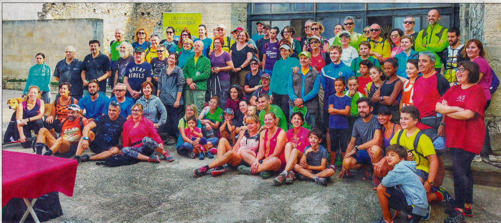
Imatge de família dels participants en l'acte d'inauguració d'aquesta nova variant.