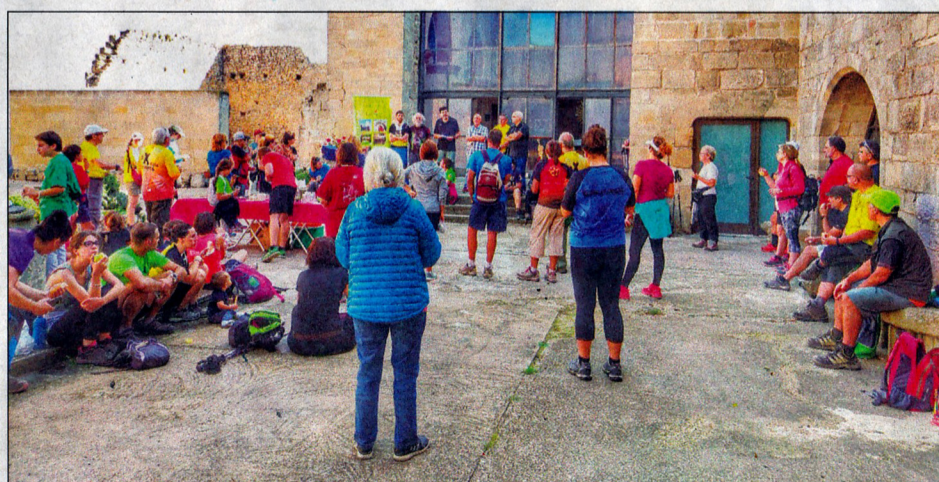
Dues imatges del moment de la inauguració amb el parlament del president del Consell Comarcal.

Es vol ampliar la xarxa de camins i itineraris de diferent interès i/o dificultat als diferents tipus de públic que recorrin a peu o en BTT la Ruta del Cister