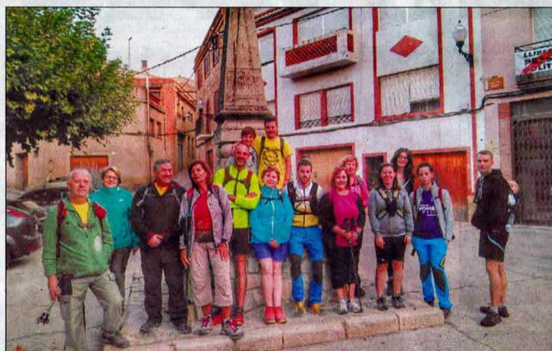
Imatge del grup de Blancafort, i a la dreta, el grup de Solivella en plena caminada.